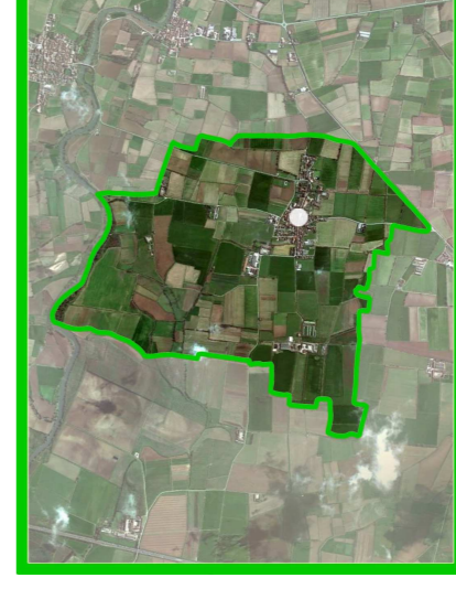
TAVOLA P2 SCALA 1:5.000